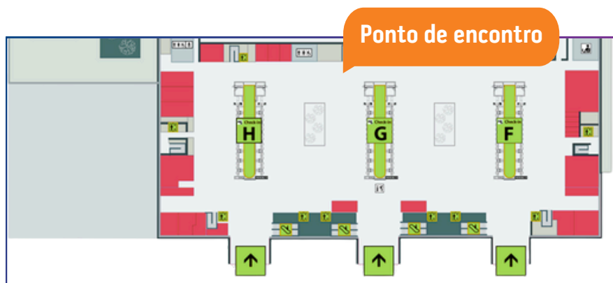
Mapa aeroporto Guarulhos - Terminal 3

Depois de despachar as malas e pegar seu cartão de embarque, siga para o ponto de encontro com o grupo, que será: em frente à loja da Latam , localizada abaixo do telão de voos, no Terminal 3, entre o check-in G e H.